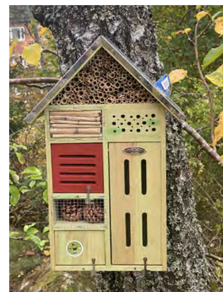
Fågelholkar och insektshotell för ett rikare djurliv på gården.