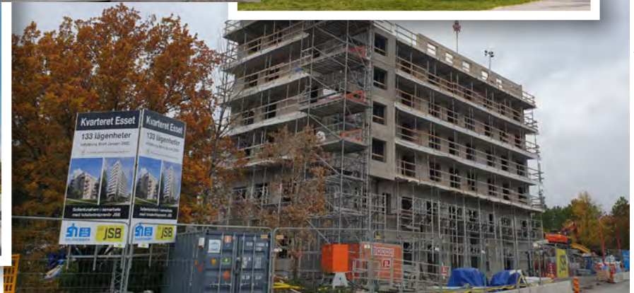
Full fart på bygget av nya kvarteret Esset.

SKISSER WINGÅRDHS