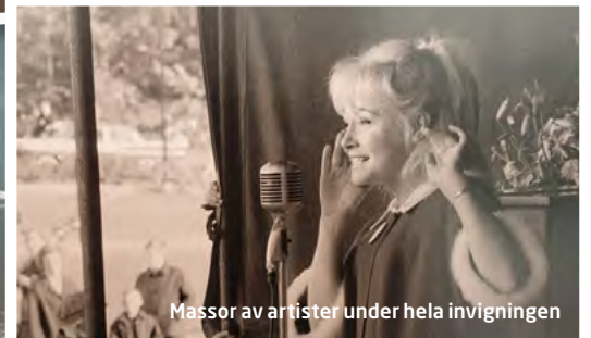
Massor av artister under hela invigningen