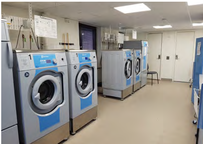
Nya, fräscha maskiner låter hyresgästerna tvätta effektivt.

I tvättstugan finns utöver de två vanliga tvättpassen möjlighet till grovtvätt och spontantvätt i lokalerna. ■