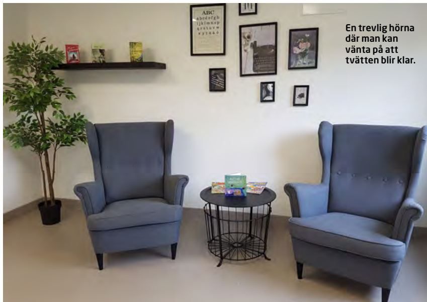
En trevlig hörna där man kan vänta på att tvätten blir klar.