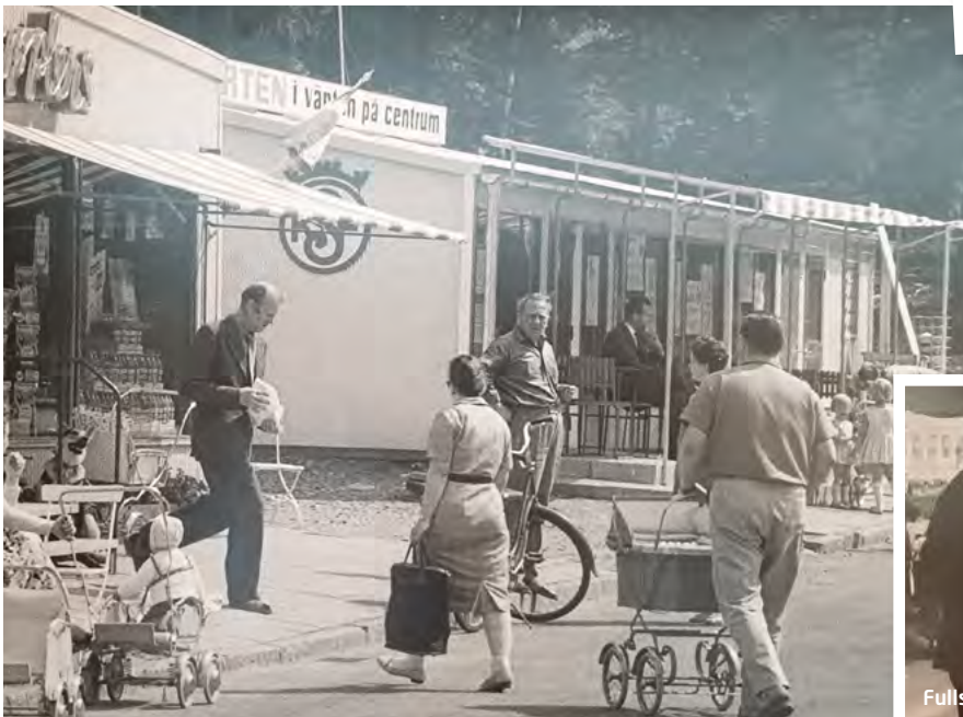
Shopping och service i splittrerna Edsbergs Centrum.