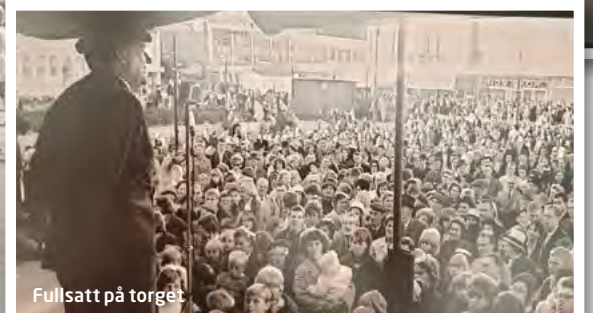
Fullsatt på torget

Sollentunahem AB Malmvägen 10 Box 6059 192 06 Sollentuna