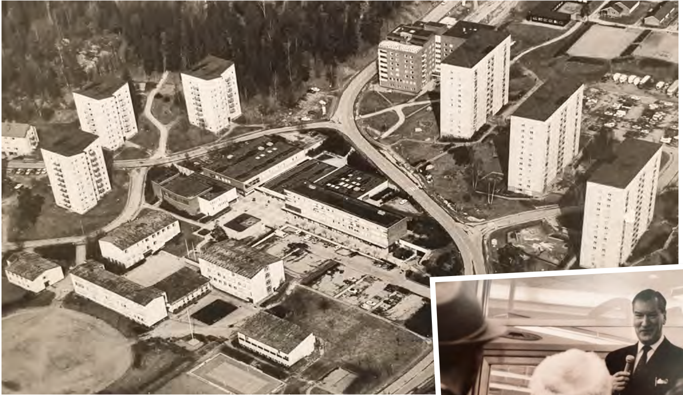
Flygbild över Edsbergs Centrum på 1960-talet.

Edsbergs Centrum invigdes 1964 och "alla" var där. För självklart drar ett helt nytt centrum med mängder av nya affärer kryddat med dåtidens kändisar mycket folk.