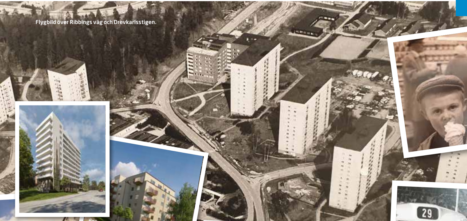
Flygbild över Ribbings väg och Drevkarlsstigen.