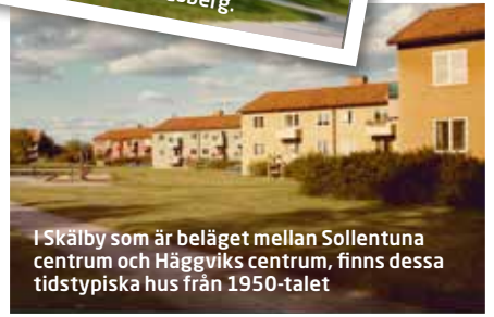
I Skälby som är beläget mellan Sollentuna centrum och Häggviks centrum, finns dessa tidstypiska hus från 1950-talet