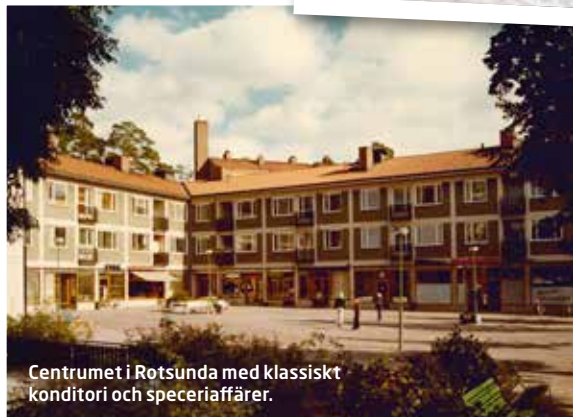
Centrumet i Rotsunda med klassiskt konditori och speceriaffärer.

Sollentunahem AB Malmvägen 10 Box 6059 192 06 Sollentuna