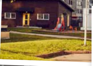
I Edsberg finns flera historiska platser, framförallt Edsbergs slott där familjen Rudbeck huserade i nästan 200 år.