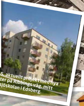
Esset 3-5, aktuellt projekt med nya lägenheter på Ribbings väg, mitt emot Rösjöskolan i Edsberg.